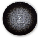
スキンソリューション スタークッション