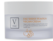
シャイニーパンプキンヴィーガン クリーム